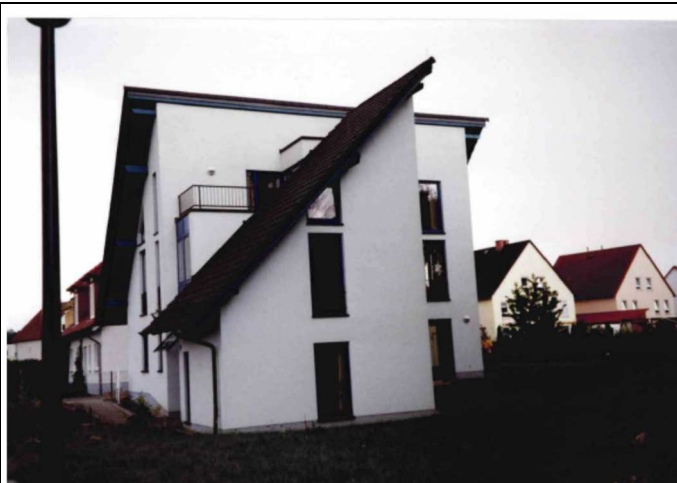
Ansicht von Nordwest