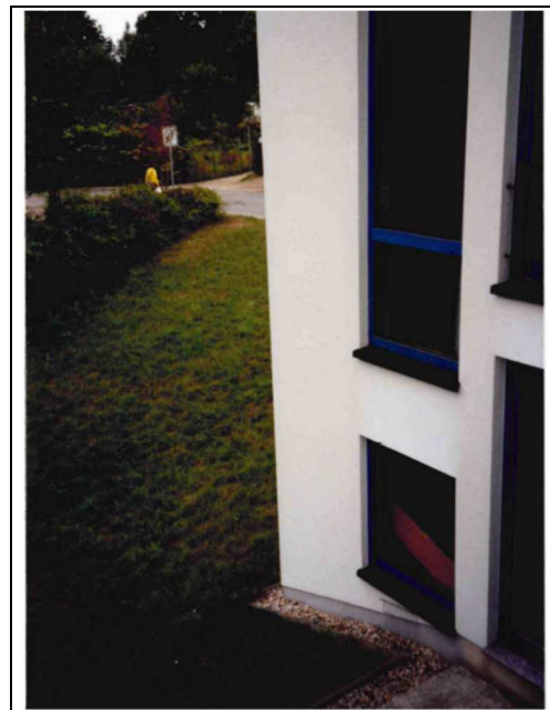
Ansicht in Richtung Nordwest